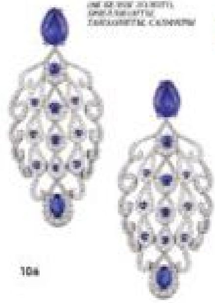
СЕРЦЕ «АРТЕНСКИ» ИЗ БЕЛОГО ЗЛАТЫ, АПРИКОВИТИ, ТАКОСИТИ СЛАЗИ