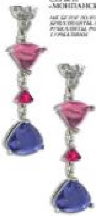
СЕРЦЕ «МОНТАНСА» ИЗ БЕЛОГО ЗЛАТЫ, АПРИКОВИТИ, ПОЛУЧАТ ГЛАЗИТИ, ПОЛУЧАТ ГЛАЗИТИ