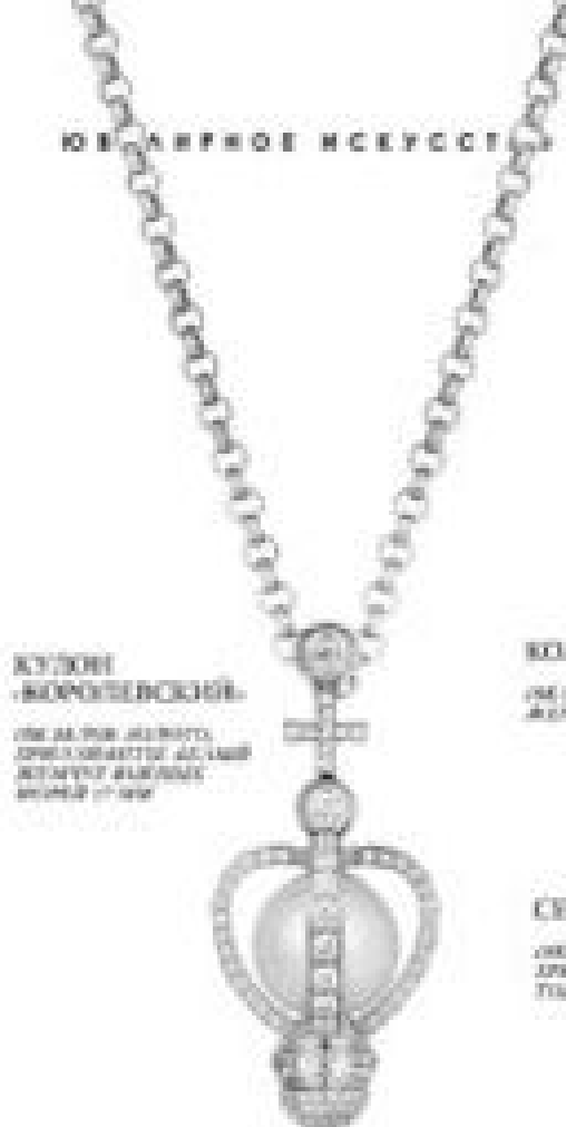
КУЛОН «КОПИЛЕНСКИ» ИЗ БЕЛОГО ЗЛАТЫ, АПРИКОВИТИ АЛМАШ И СТАРИН РАДИКАЛ ВЕСИНА 17,100