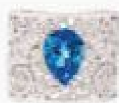
КОЛЧЕО «ДРИМ МОИ» ИЗ БЕЛОГО ЗЛАТЫ, АПРИКОВИТИ, ПОЛУЧАТ ГЛАЗИ