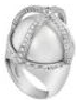
КОЛЧЕО «МОИМА» ИЗ БЕЛОГО ЗЛАТЫ, АПРИКОВИТИ АЛМАШ ВЕСИНА 21,100